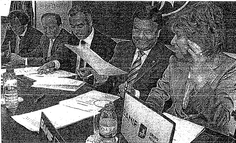
A cerimónia de assinatura do protocolo teve lugar ontem no Funchal.

CATANHO FERNANDES cfernandes@dnoticias.pt