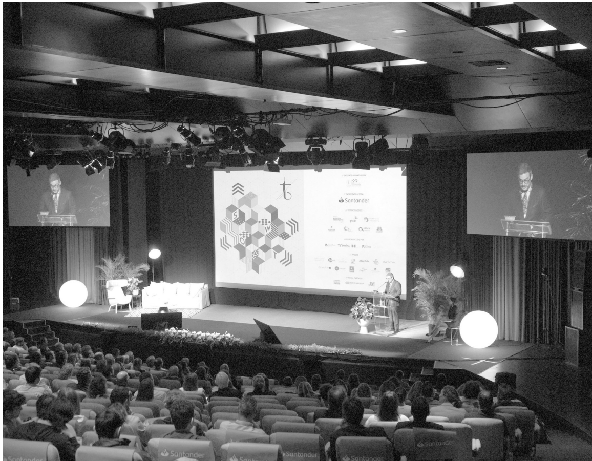
Evento irá decorrer durante uma manhã no Centro de Congressos da Madeira.

Assim, pretende-se pensar e debater o “peso do sector do Turismo na Economia, vantagens e fragilidades desta ‘especialização’ e grande dependência com um quarto (25%) do PIB (Produto Interno Bruto) da Região Autónoma da Madeira a depender do sector e limitações da revolução tecnológica em curso poder criar aumentos de produtividade significativo que permitiram, no médio prazo, ao sector remunerar bem a generalidade dos seus colaboradores, permitindo carreiras, criando retenção de talento, etc.”, idealiza.